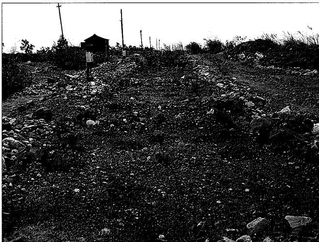
Fig. 2: Partial view of the plateau study on the recultivation of mining sites on Chinh Bac dump, north-eastern Vietnam, in March 2010

Generally, it is not advisable to plant the species in monoculture plantations; this will likely increase the risk of pests. Moreover, some of the study species are deciduous, and monocultures of these species will leave recultivated mining sites leafless for a yearly period of time. In contrast, if species are planted in mixed cultures, recultivated sites will stay green throughout the year, which is one of the main aims of VINACOMIN. Mixed cultures will also decrease the risk of pests.