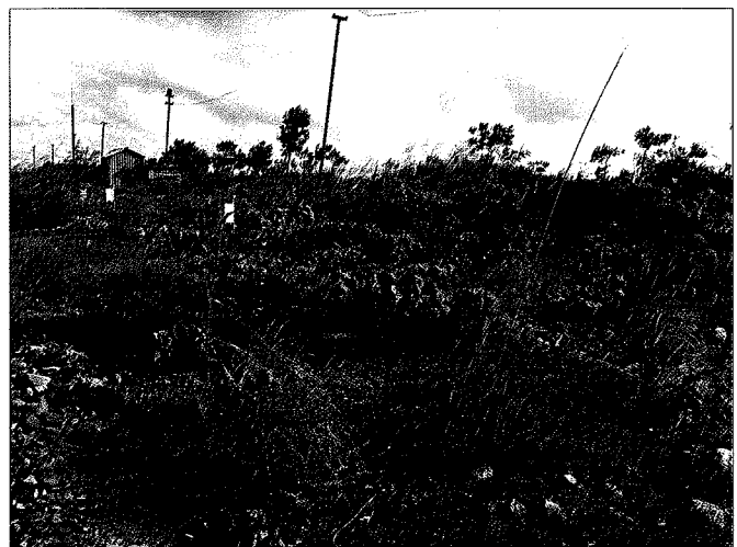
Fig. 3: Partial view of the plateau study on the recultivation of mining sites on Chinh Bac dump, north-eastern Vietnam, in July 2011

Eine Pflanzung der Baumarten in Monokultur ist nicht empfehlenswert, da dadurch das Risiko durch Schädlingsbefall erhöht wird. Zudem sind einige Arten laubwerfend und würden in Monokulturen zu zeitweise kahlen Halden führen. Da ein wesentliches Ziel von VINACOMIN die Schaffung einer dauerhaft grünen Bergbaufolgelandschaft ist, sind Mischkulturen aus Arten, die zu verschiedenen Zeiten Laub werfen, empfehlenswert.